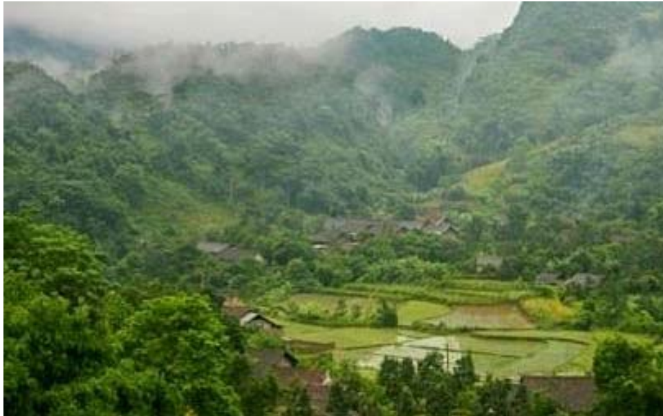
ກິນອາຫານຖືກຫຼັກໂພຊະນາການ, ສະພາບພູມສັນຖານມີຄວາມຍືດຍຸ່ນ