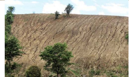
ລະບົບການປູກພືດຕະກູນດຽວ