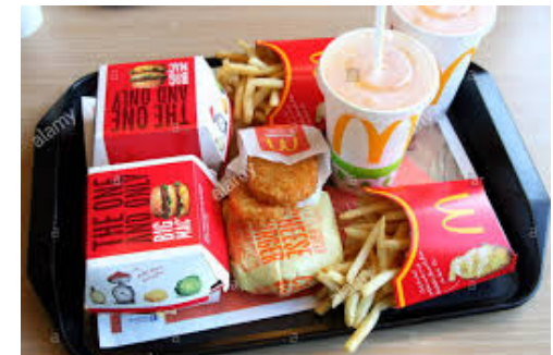
ຜົນໄດ້ຮັບ: ເປັນອາຫານທີ່ ນໍ້າເຂົ້າ, ອາຫານແປຣຸບ, ຄຸນຄ່າທາງໂພຊະນາ ການຕໍ່າ