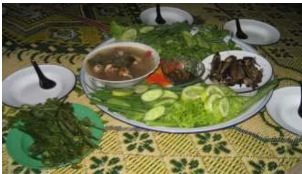
ຜົນໄດ້ຮັບ: ການກິນ ອາຫານສົມດຸນ, ຖືກ ຫຼັກໂພຊະນາການສູງ (ອາຫານທ້ອງຖິ່ນທີ່ມີ ຄວາມຫຼາກຫຼາຍ)