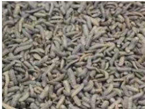
Black Soldier Fly larvea