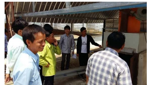
Farmers visiting XP trading factory in Xieng Khouang 2017