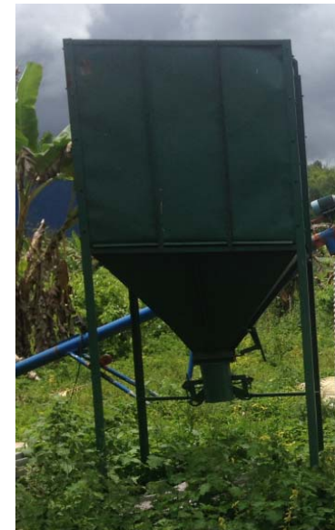
Hoppers with baggers