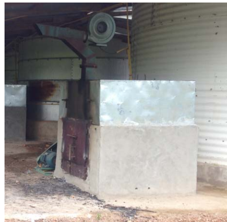
Ovens with fans